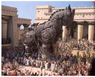
Caballo de Troya (La Iliada)