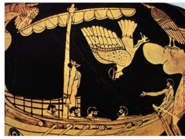
Ulises atado al mástil (La Odisea)